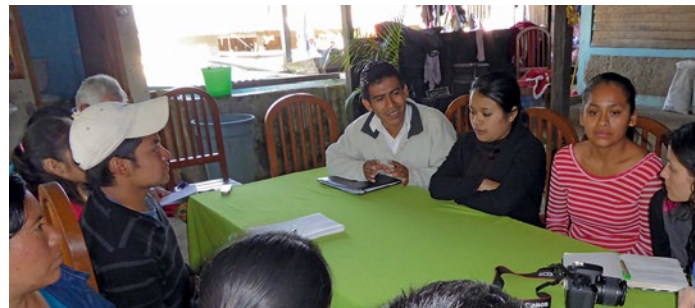
Reunión del grupo Akib'al

El proyecto se compone de varios aspectos: encuestas, encuentros intergeneracionales, producción y difusión de videos y de folletos, programas en la radio local. Será la primera experiencia de gestión de proyecto para estos jóvenes, determinados en afirmar su identidad maya y en servir su comunidad. Además, gracias a contactos de Tradiciones para el Mañana con organizaciones en Guatemala que trabajan desde hace largo tiempo en salud tradicional, los jóvenes de Akib'al podrán establecer lazos con su país de origen. El proyecto ha obtenido el apoyo de la Fundación Horizonte de los Países Bajos. ■