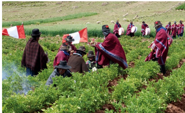
Ceremonia a las futuras papas.

Al final de esta relación larguísima, Tradiciones para el Mañana expresa su profundo reconocimiento a Chuyma Aru por esta colaboración excepcional que tanto le ha aportado. ■