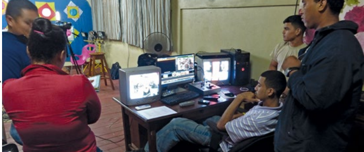
El equipo de jóvenes de Canal 22